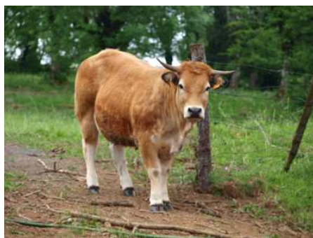
Génisse de 2 ans (doublonne) prête pour l'abattage

Roland Carrié est éleveur de bovins allaitants de race Aubrac en bio dans le Nord de l'Aveyron sur la commune de Vitrac en Viadenne. Il exploite 120 ha de prairie permanente avec un troupeau de 75 mères. Malgré les hivers rigoureux, cet éleveur arrive à limiter ses achats en céréales. « A 1 100 m d'altitude, il est difficile de produire autre chose que de l'herbe ».