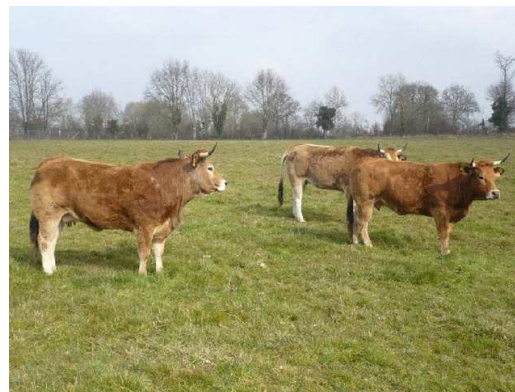
Réformes parthenaises à l'engraissement

De plus en plus employée dans l'Ouest de la France, cette technique est encore peu répandue dans nos territoires. Elle pourrait cependant être employée dans des fermes qui utilisent moins de surface, et où le potentiel agronomique des sols est important (sols profonds, bonne pluviométrie). Ces techniques vont demander plus de travail et de surveillance pour l'éleveur que le système extensif, mais il reste relativement moindre qu'un engraissement traditionnel à l'auge. Cette technique va optimiser les valeurs de l'herbe et son assimilation. Des races moins rustiques pourront aussi être conduites de la sorte. Le CIVAM du Haut Bocage réalise des expérimentations sur ce thème que nous présenterons ici.