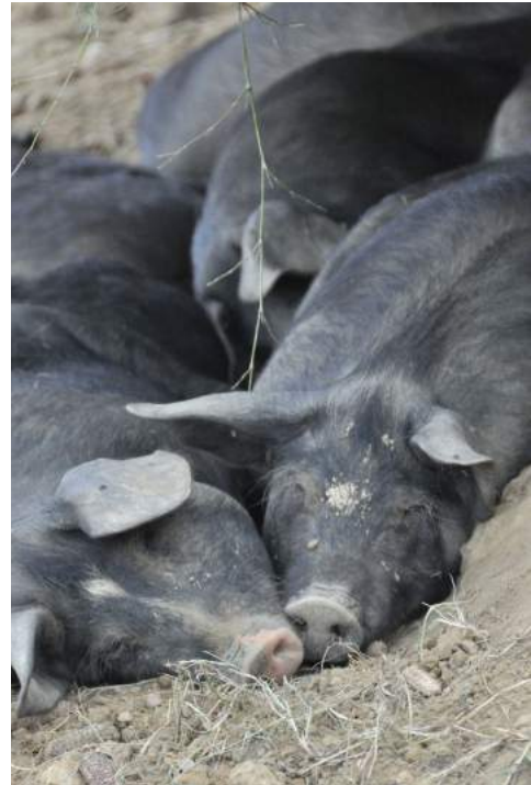
Le porc est un animal résolument social

Cela sera a priori moins gênant pour la finition , même si cela risque le favoriser des carcasses plus lourdes et grasses, avec proportionnellement un peu moins de viande sur les carcasses.