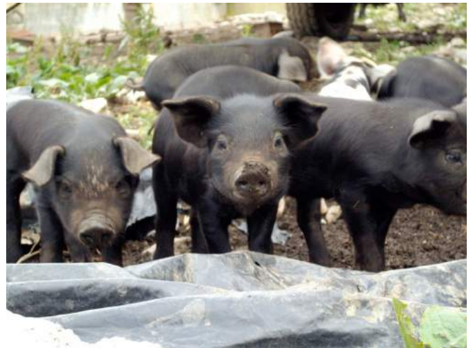
Porcelets gascons (APABA)

Les porcelets sous la mère doivent avoir accès à de l'eau potable dès le début de leur vie. Le système d'approvisionnement doit être de type tétine ou bol et placé à bonne hauteur pour que les porcelets puissent boire facilement. La distribution d'une eau de qualité en quantité suffisante (vérifier la vitesse d'écoulement) est vitale notamment quand il fait chaud, lors d'épisodes de diarrhées ou après 4 semaines de lactation quand la production de lait commence à décroître alors que les besoins en eau augmentent.