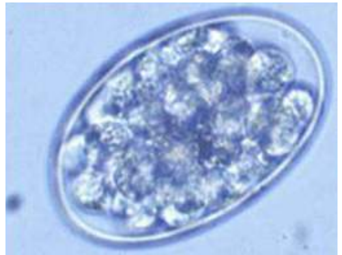
Hyostrongylus rubidus (ENVL)

Il faut donc rechercher le juste équilibre!