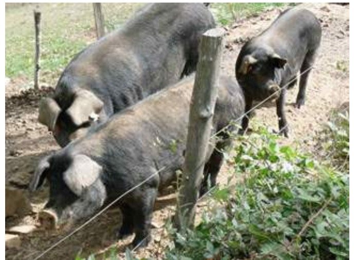
Porcs gascons conduits en plein air (APABA)

Concernant les grandes cultures , la conversion est de 2 ans comme pour les autres élevages.