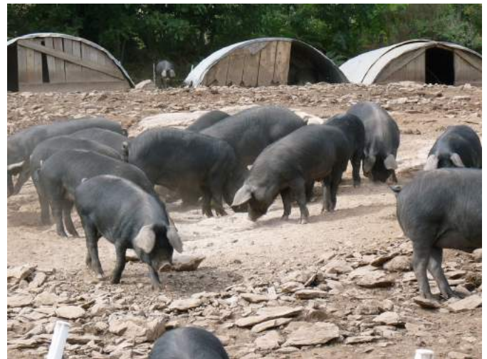
Élevage plein air de gascons et cabanes (APABA)

En Italie, la mise bas et le sevrage ont lieu majoritairement (environ 95 %) en plein-air. Les charcutiers sont élevés en plein-air (environ 60 %) ou en bâtiment avec une courette extérieure.