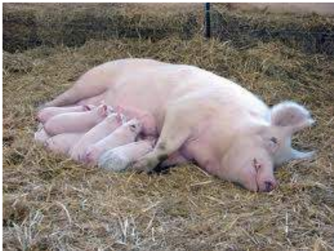
Truie large white allaitant ses porcelets (Web)

- Contrôler la température ambiante pour qu'elle soit comprise dans la zone de confort thermique qui se situe entre 7 et 26 °C en lactation et, entre 12 et 31 °C en gestation pour des truies sur litière ayant une consommation alimentaire normale.