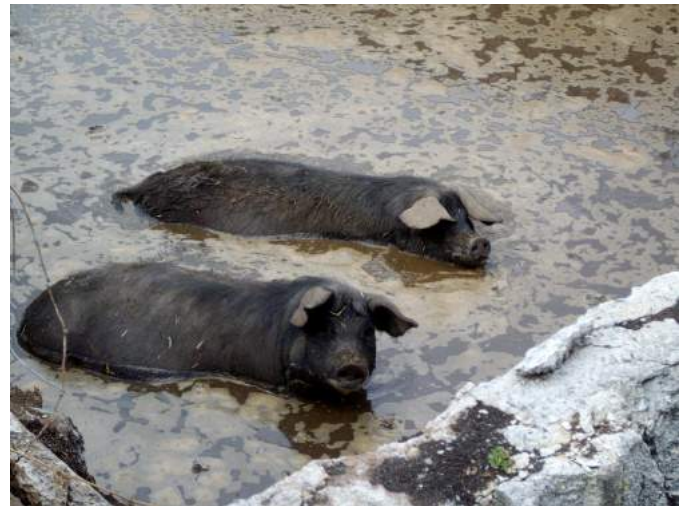
Les porcs sont friands de boue mais doivent pouvoir sécher facilement