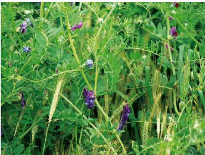
Les méteils, solution pertinente (Web)

Les mélanges peuvent ensuite être récoltés, stockés et utilisés tels quels. Pour optimiser la formulation des aliments, l'idéal est de pouvoir les trier à la récolte pour permettre ensuite l'utilisation séparée de la céréale et du protéagineux.