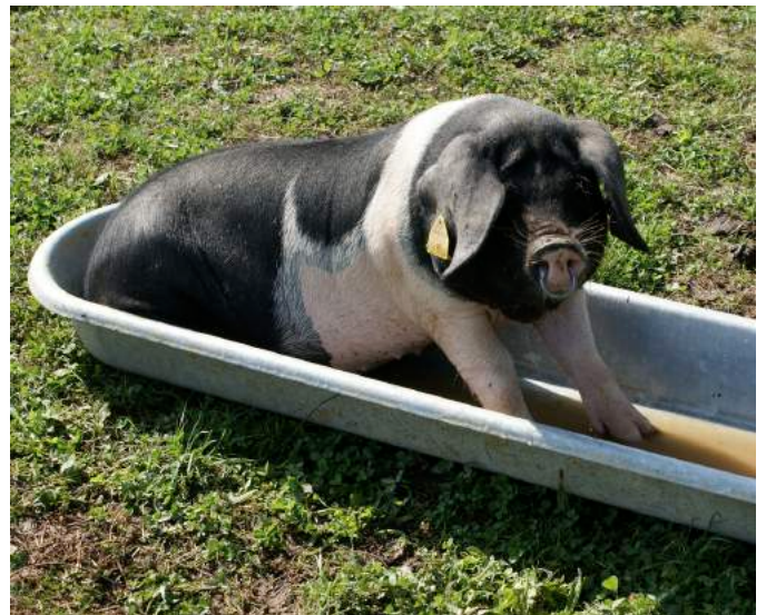
L'hygiène est importante, même pour les porcs! (Web)

Lorsque l'élevage est de très petite taille, ce type de conduite est souvent difficile du fait de la cohabitation de plusieurs stades dans le même bâtiment. Dans les élevages de plein-air, il est très difficile de protéger les porcs contre les pathogènes issus de la faune sauvage ou des visiteurs .