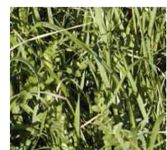
Exemple de mélange ray-grass+vesce semés à 20 et 15 kg/ha

Graminées + légumineuses : intéressant en rotation de légumes